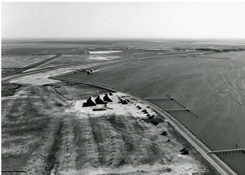
Uitzicht vanaf de straalverbindingstoren van de PTT op de Houtribhoogte te Lelystad, 30 juni 1976. Centraal op de foto de Driekap, het expositiegebouw van de RIJP. De Driekap brandde in 1987 af. Nu staat er het gebouw van Nieuw Land Erfgoedcentrum (foto: J.U. Potuyt, bron: Nieuw Land Erfgoedcentrum in Lelystad, Collectie RIJP).