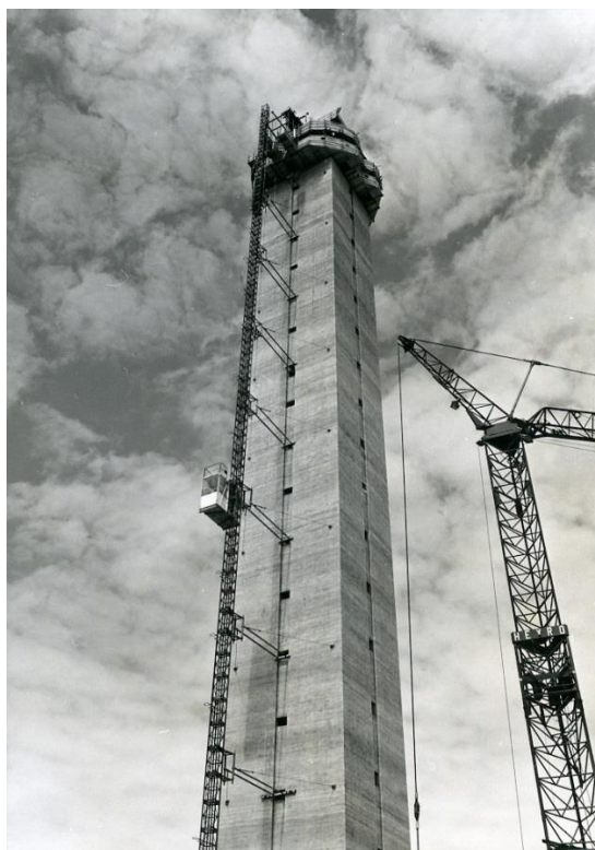
De straalverbindingstoren van de PTT in aanbouw op de Houtribhoogte te Lelystad, 4 juni 1976 (foto: J.U. Potuyt, bron: Nieuw Land Erfgoedcentrum in Lelystad, Collectie RIJP).